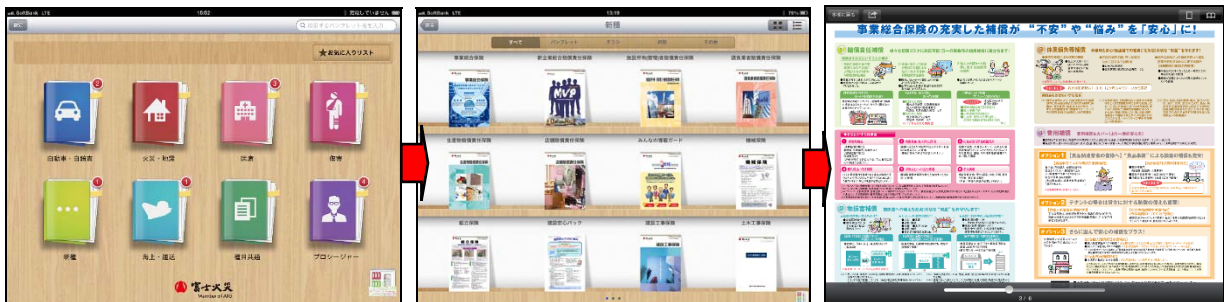
[プレビュー（閲覧）画面]